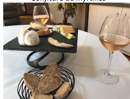
L'ardoise pour 2 : 15.00 €

Gelée de fleurs de pissenlit Gelée de coing et d'églantine Confiture de myrtilles