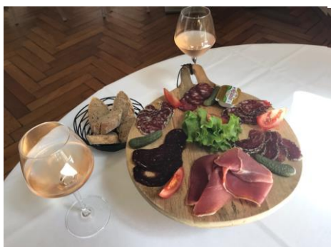
La planche pour 2 : 11.00 €

Jambon sec d'Auvergne Lingot de bœuf de Salers Pavé nature Pavé aux herbes Pavé au poivre Saucisson fumé