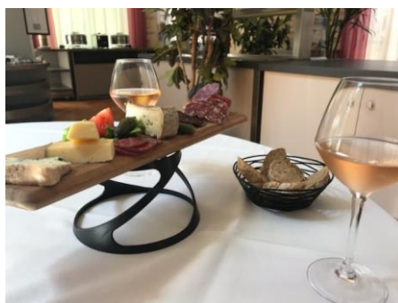
La planche pour 2 : 13.00 €

Jambon sec d'Auvergne Lingot de bœuf de Salers Pavés Saint-Nectaire fermier Cantal entre-deux Gaperon de Lembron Bleu de Laqueuille